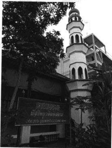
หออะซาน ในปัจจุบัน ของสุเหร่าตึกแดง

ในย่านฝั่งธนบุรี เช่นเดียวกันที่เรียกว่า ถิ่นฐาน “ก๊กฟากชะโน้น” ในสายของสมเด็จพระยาองค์ใหญ่ ที่ถูกขนานนามว่า ย่านบ้านแขก ในช่วงรัชกาลที่ ๓ ลงมา เมื่อครั้งยังไม่มีถนนหนทางเจริญเข้ามาถึง ย่านนี้เป็นถิ่นฐานตั้งแต่จวนสมเด็จพระยาฯ (ติศ) และบุตรชายที่อยู่ตั้งแต่ริมฝั่งแม่น้ำเจ้าพระยาเข้ามา จวนสมเด็จพระยาฯ (ช่วง บุนนาค) จนถึงที่ดินของท่านผู้หญิงจันทร์ ผู้เป็นมารดาของสมเด็จพระยาฯ (ช่วง) เป็นย่านบ้านของผู้คนที่สมเด็จพระยาฯ (ติศ) กวาดต้อนย้ายครัวหลายครั้ง โดยนำผู้คนเหล่านั้นมาตั้งบ้านเรือนอยู่ในละแวกจวนของท่าน ทั้งลาวเวียง มอญ ฝัพายหลวง จนถึงบ้านแขกตานี ฯลฯ