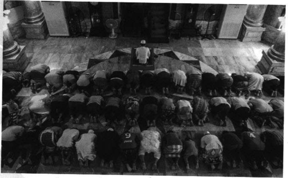
การประกอบศาสนกิจ (ละหมาด) ที่สุเหร่าบ้านสมเด็จ (นุรุลมุบีน)