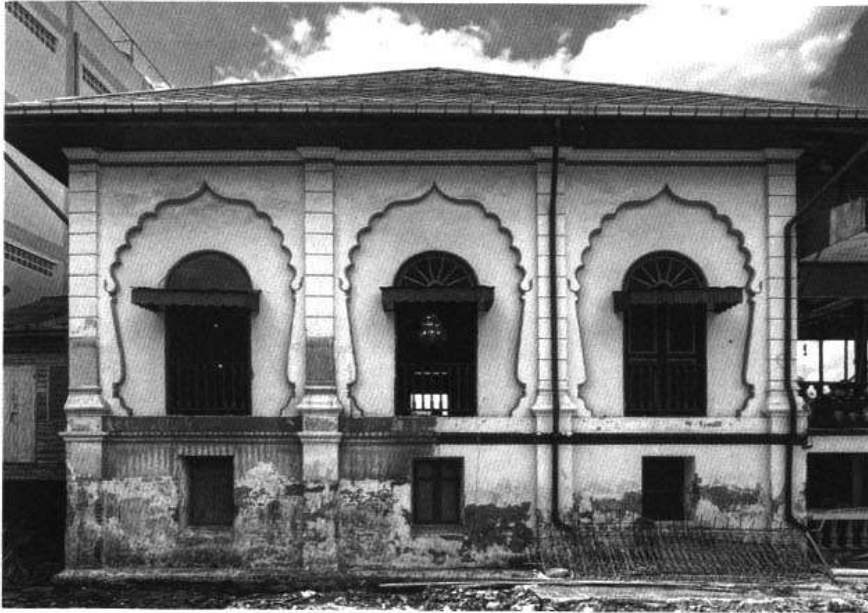
สุเหร่าตึกแดง หรือมัสยิดกุฎิลอิสลาม ในปัจจุบันหลังจากการปรับปรุงภูมิทัศน์แล้ว

สุเหร่าแรกที่จะขอกกล่าวถึง ได้แก่ “สุเหร่าตึกแดง” เป็นสุเหร่าที่ได้รับการอุปถัมภ์โดยสมเด็จพระยาบรมมหาพิชัยญาติ หรือสมเด็จพระยาองค์น้อย ที่ชาวบ้านในย่านคลองสานอันเป็นถิ่นฐานของสมเด็จพระยา มักจะเรียกขานกันอย่างคุ้นเคยว่า “ตะโต๊ะสมเด็จพระเจ้า”